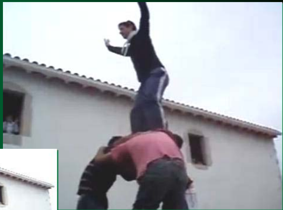
Castellets de Sant Antoni

La romeria de Sant Antoni és una festa molt important per als peniscolans (gent de Peníscola). És una festa molt popular i arrelada no sols per als seus habitants sinó també per a qualsevol que vulga conèixer l'essència de Peníscola.